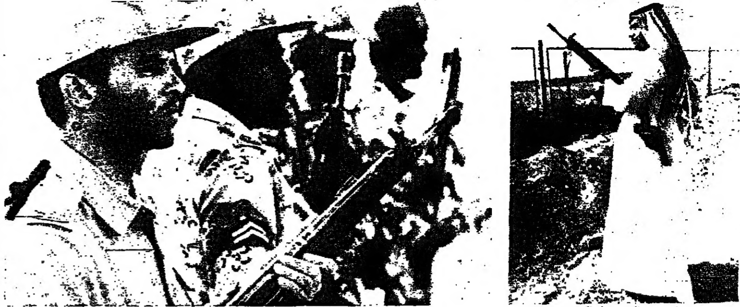
جنود سعوديون في موقع جنوبي مع الكويت

في الوقت الذي تبدو فيه واشنطن وقد أوسدت الباب في وجه الجهود الدبلوماسية في أزمة الخليج، تقوم مجموعة من الزعماء العرب والأوروبيين ببذل جهود لإيجاد الحلول المتعددة والعراق عن شفا الحرب. وقال دبلوماسي عربي في واشنطن - إنه سباق بين المدفع وغصن الزيتون في المنطقة (الشرق الأوسط). ويبدو أن المدفع سيكون الطرف الفائز. وقد صحت الولايات المتحدة عدة مبادرات مباشرة وغير مباشرة من جانب العراق لإجراء محادثات لحل الموقف المتخبط الناتج عن غزو العراق للكويت في الثاني من الشهر الحالي، وما تبع ذلك من استخدام الجانب المحتجزين في البلدين كرهق بشري يقي من أي هجوم أميركي.